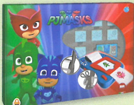
0989 STICKER MACHINE PYJAMASQUES Contient : une machine pour fabriquer des auto-collants, 7 tampons, 12 feutres, 1 tampon encreur, 1 rouleau de papier sticker, 1 paire de ciseaux. Dès 3 ans.