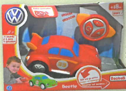
0373 BEETLE R/C La coccinelle de Volkswagen radiocommandée. 4 sons. Marche avant et demi tour. Bruits de moteur. Fonctionne avec 3 piles LR06 pour la voiture et 2 piles LR03 pour la télécommande fournies. Dès 2 ans.