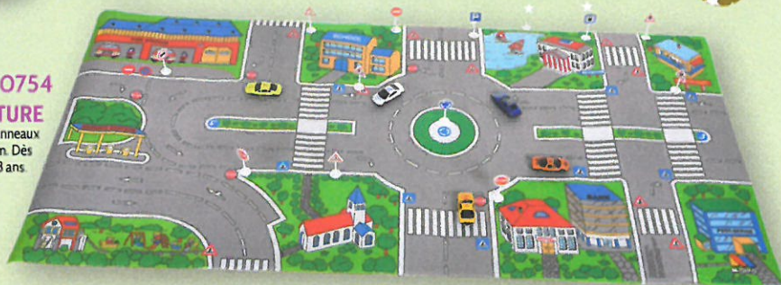
0754 TAPIS ET VOITURE Livré avec 5 voitures et 24 panneaux trafic. Dim : 125 x 60 cm. Dès 3 ans.