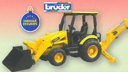
0725 TRACTOPELLE JCB Entièrement fonctionnel et détachable : pelle devant et godet arrière. Le siège du conducteur pivote. Dès 3 ans.