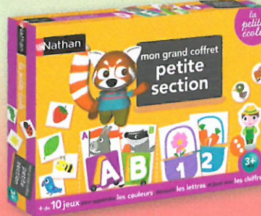
1041 MON GRAND COFFRET PETITE SECTION Un coffret offrant un éventail de jeux progressifs où se déclinent plus de 10 variantes soit pour jouer seul en autonomie, soit pour apprendre à jouer ensemble : le loto des couleurs, le petit train des lettres, le jeu des 5 paniers (chiffres et quantités) ou encore le grand jeu de la ferme. Idéal pour préparer la rentrée des classes ou pour réviser le programme en s'amusant ! Dès 3 ans.