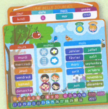
1035 AGENDA MAGNÉTIQUE UNE BELLE JOURNÉE Cet agenda accompagnera votre enfant pendant 4 ans. Il est idéal pour lui apprendre à acquérir la notion du temps tout en devenant autonome. Dès 3 ans.