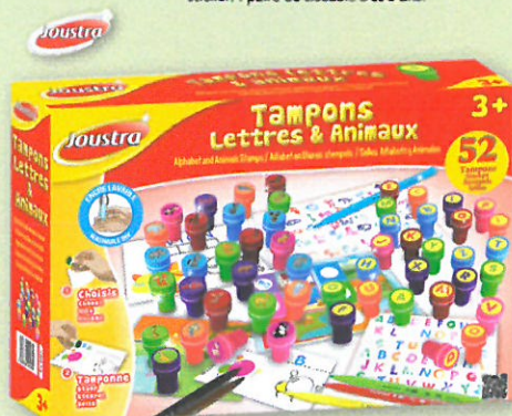
0987 TAMPONS LETTRES ET ANIMAUX Activités de tampons sur le thème de l'alphabet et des animaux : 52 tampons pré-encreurs aux couleurs variées. 1 carnet ludo-éducatif coloré fourni. Encre lavable. Dès 3 ans.