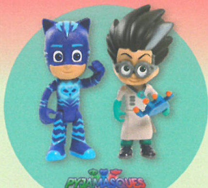
0689 2 FIGURINES PYJAMASQUES 1 figurine Héros lumineuse et 1 figurine Vilain articulée de 7,5 cm. Modèles assortis. Dès 3 ans.